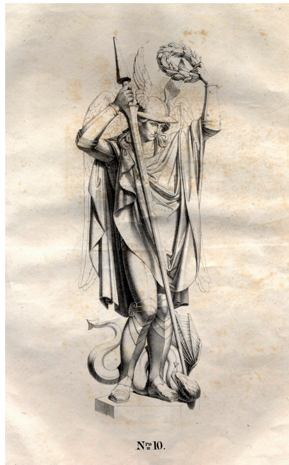
Abb. 2 Nr. 10 von 12 Figuren auf dem Kreuzbergdenkmal, „Laon“, nach: Magazin von Gusswaren der Königlichen Eisengießerei, 7. Heft; 1828