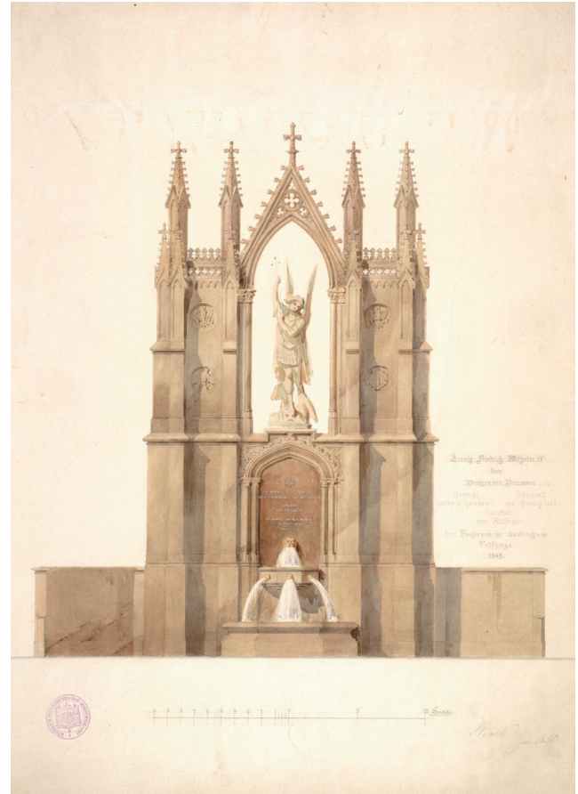
Abb. 3 Johann Heinrich Strack: Entwurf für das Erinnerungsmal an den badischen Feldzug (1849) von August Kiss im Park Babelsberg, Januar 1850, Bleistift, aquarelliert in braun und grau (SPSG, Planslg. 5939)

Auch das Kreuzbergdenkmal hatte zur Zeit seiner Entstehung 1817 bis 1821 einen deutlichen Bezug zur Figur des Erzengels (Abb. 1, 2). Nicht nur, dass zwei der Genien eine Ähnlichkeit mit den beiden Heiligen Georg und Michael aufweisen, auch die gesamte Ausrichtung des Denkmals orientierte sich auf das Hallesche Tor. Und dort stand zwischen den Torflü-